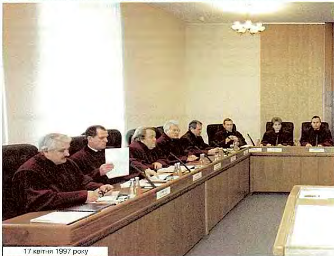
17 квітня 1997 року

Конституційний Суд України — єдиний орган конституційної юрисдикції в Україні, завданням якого є гарантування верховенства Конституції України як Основного Закону держави на всій території України.